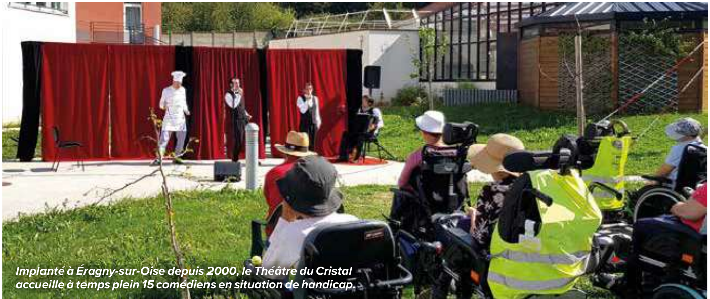
Implanté à Éragny-sur-Oise depuis 2000, le Théâtre du Cristal accueille à temps plein 15 comédiens en situation de handicap.