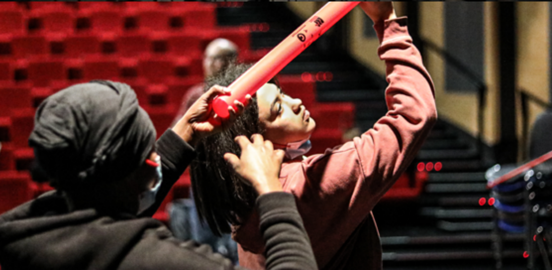
Rencontre étudiants / jeunes d'un foyer de vie.